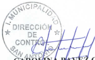
CAROLINA PAVEZ CORNEJO DIRECTORA DE CONTROL